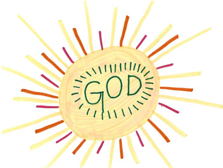
Iman Mollaian, 10 éves