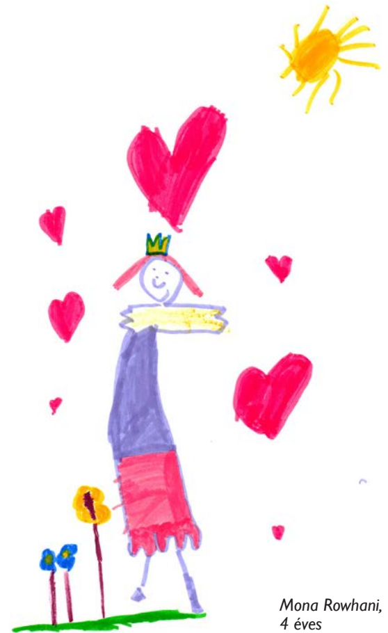
Mona Rowhani, 4 éves