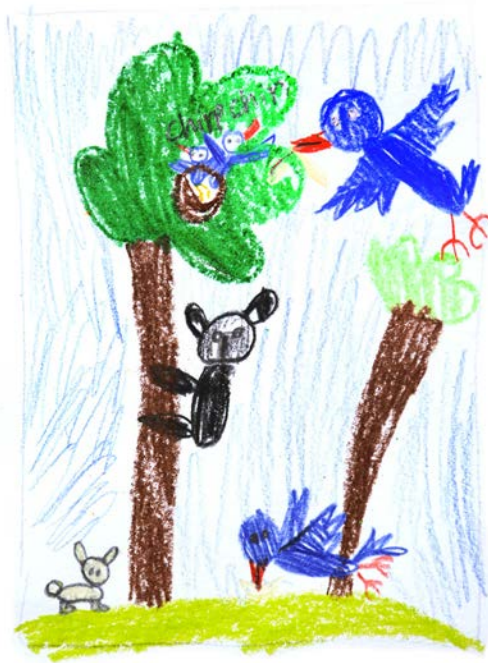
Aliyah Sobhani, 8 éves