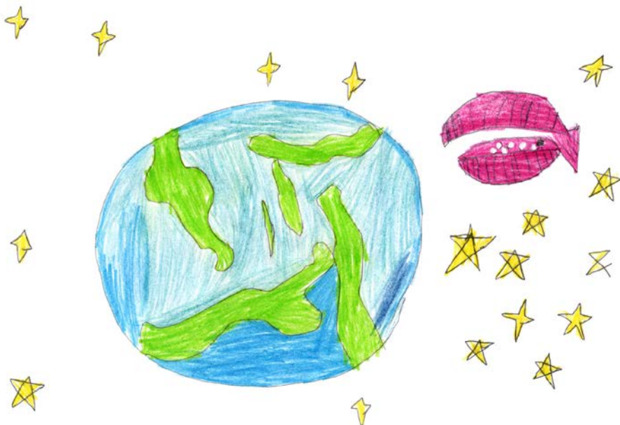
Woods Dániel, 9 éves