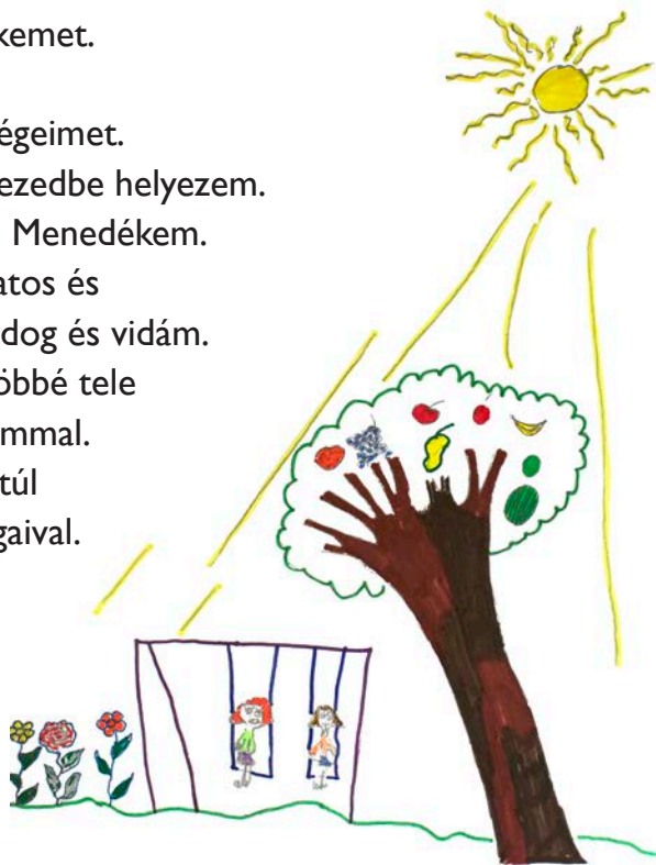
Núr Ebrahimzadeh, 6 éves