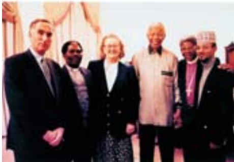
A bahá'í hit és más vallások képviselői Nelson Mandelával (jobbról a harmadik), a Dél-afrikai Köztársaság elnökével (Cape Town, 1999).

A fegyveres harcoknak mindenütt a Földön meg kell szünniük, és le kell rakni a tartós béke alapjait. A világbéke egy kétlépcsős folyamat eredményeképpen valósítható meg: az első egy politikai békekötés az országok vezetői között (Kiseb-bik Béke), a második pedig egy alapvető szellemi átformálódás révén, az egyének szívéből kiinduló béketörekvés kifejeződése (Leg-nagyobb Béke). Minden világval-lás próféciai megerősítik a Leg-nagyobb Béke eljövételét.