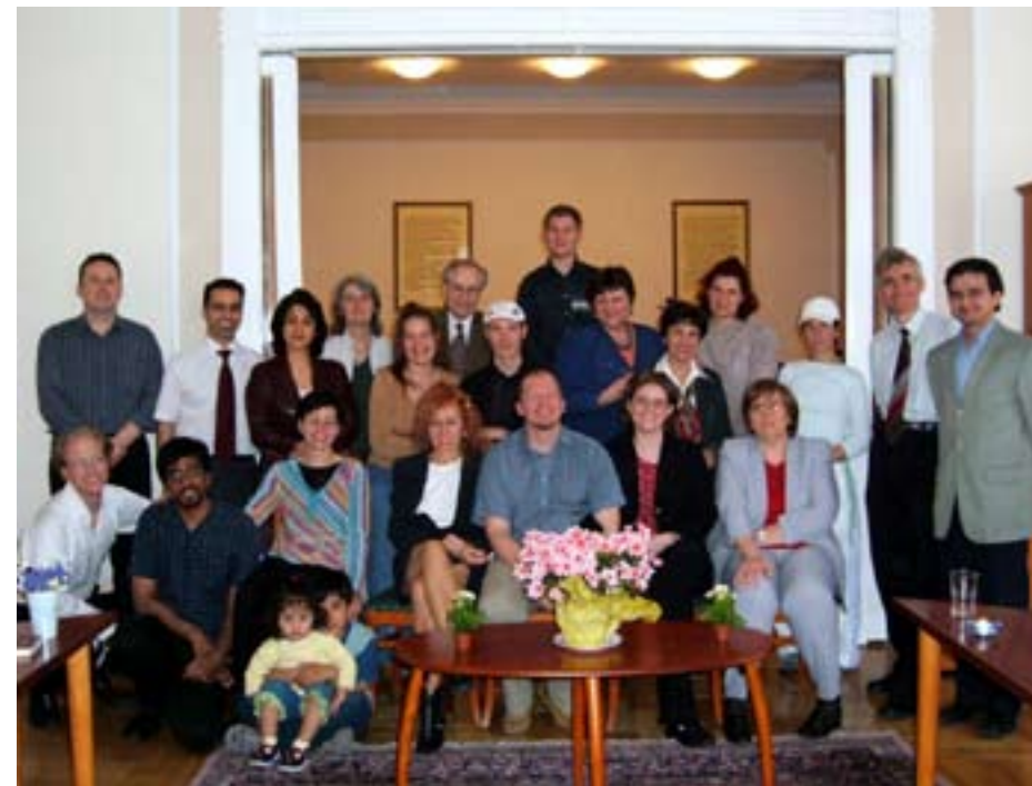
A magyarországi bahá'í közösség néhány tagja (Budapest, 2005).

Ma több, mint 1100 bahá'í él hazánkban, akik között vannak a világ távoli tájairól származó, például amerikai, brazil, iráni, kanadai hívők is. A roma kisebbség jelentős hányadot képvisel a magyarországi közösségben, nagymértékben hozzájárulva közösségünk szépségéhez és kulturális, szellemi gazdagságához.