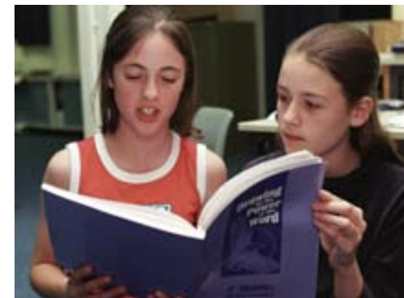
Tinédzserek tanulmányozzák a bahá'í tanításokat (Perth, Ausztrália).

A bahá'iook gyermekei nem lesznek automatikusan bahá'í vallásúak. Szüleik feladata beléjük plántálni Isten szeretetét és megismertetni velük a különböző vallásokat. Elérve a felnőtt kort, a fiatalok szabadon dönthetnek, melyik vallást választják.