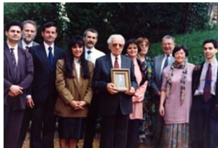
A első Magyarországi Országos Szellemi Tanács tagjai a Bahá'í Nemzetközi Közösség két képviselőjével (Budapest, 1992).

„Mindegyikötök kötelme, hogy valamiféle foglalatossághoz fogjon, legyen az mesterség, kereskedés és hasonlók. Mi kegyesen dicsérjük ilyenén foglalatosságaitokat, mint Isten imádásának egy formáját, ki az Egy Igaz.”