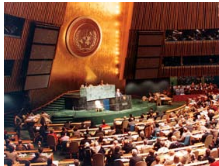
1948 óta a Bahá'í Nemzetközi Közösség képviselői számos ENSZ konferencián szólaltak fel. A Bahá'í Nemzetközi Közösség konzultációs szinten részt vesz a UNICEF, a UNIFEM, és az ECOSOC munkájában.

Bahá'u'lláh több, mint 100 évvel az ENSZ megalakulása előtt felszólított egy világparlament létrehozására, melynek feladata az emberiség szolgálata és az egész világ jólétének biztosítása kell legyen. A jövő társadalmában világpolgárokként kell élnünk, és szeretnünk kell nemcsak a saját országunkat, hanem az egész világot is.