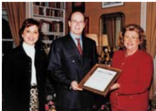
Albert, Monaco hercege fogadja a Monaco-i Országos Szellemi Tanács képviselőit (2000).

A vallás célja nem az, hogy háborúkat és viszályt szítson, hanem az, hogy egységet teremtsen. Ellenkező esetben hiánya jobb, mint megléte.