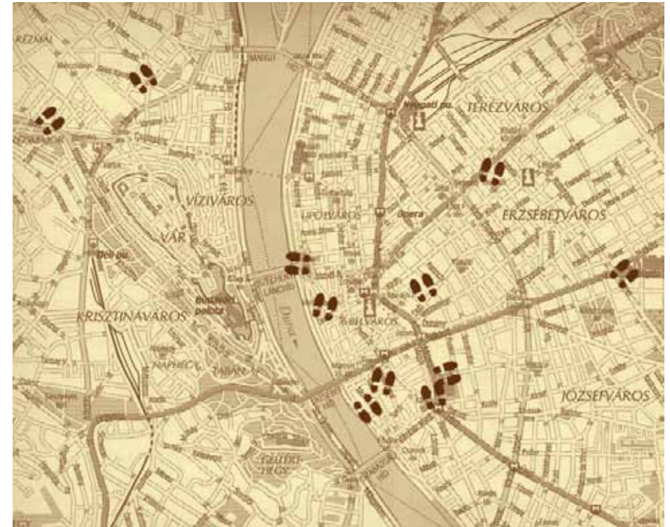
Az ‘Abdu’l-Bahá által meglátogatott helyszínek Budapesten

Ó, kegyes Úr! Ragyogd be a szíveket legnagyobb útmutatásod fényével. Éleszd újra a lelkeket legboldogítóbb örömhíreiddel. Ragyogd be a szemeket azáltal, hogy megláthatják fényeidet. Tedd a füleket figyelmessé azáltal, hogy meghallhatják