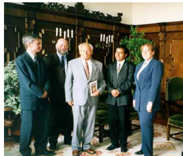
Göncz Árpád (középen), a Magyar Köztársaság elnöke, fogadja a Magyarországi Bahá'í Közösség képviselőit (Budapest, 1999. május).

ségüket. Az 1930-as években kialakult első közösség tagjai szinte kivétel nélkül zsidó származásúak voltak. Beindult a közösségi élet, nyilvános előadásokat tartottak, könyvet adtak ki. A csoport 1937-től kezdve rendőri felügyelet alatt, egyre nehezebb körülmények között működött. 1939-re a hívek száma ettől függetlenül már eleget volt ahhoz, hogy megalapíthassák