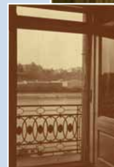
Az egykori Ritz szálló