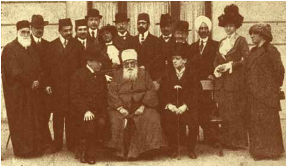
‘Abdu’l-Bahá kíséretével Budapesten, 1913. április

Minden földi mérce szerint ‘Abdu’l-Bahá képtelen lett volna 66 éves korában hároméves világszerte utazni, hiszen gyermekkorától száműzetésben élt, hivatalos oktatásban nem részesült, egészsége megromlott és a nyugati szokásokat